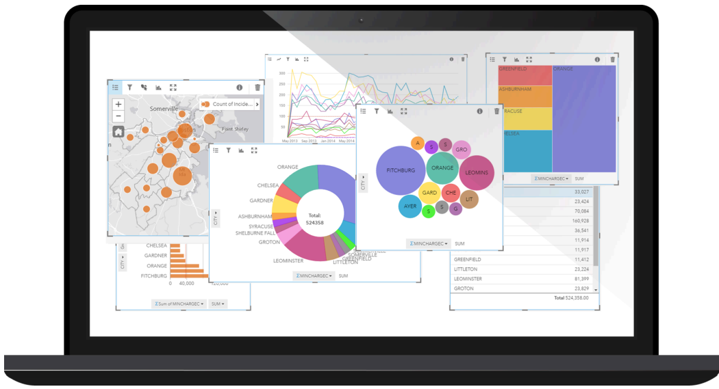
▲ 참고이미지2. 다양한 스타일로 데이터 분석 결과를 시각화하는 Insight for ArcGIS